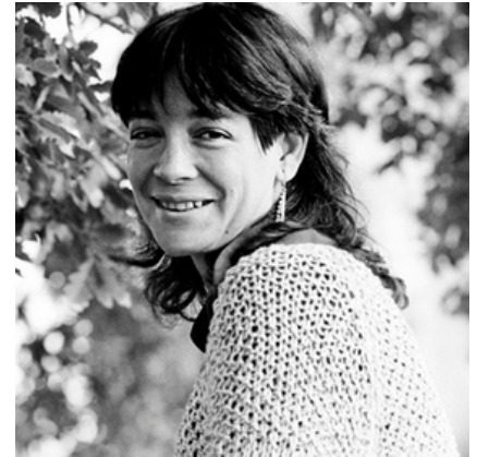
Autora del poema: Maria Mercè Marçal

Vols venir a la meva barca? -Hi ha violetes, a desdir! anirem lluny sense recança d'allò que haurem deixat aquí.